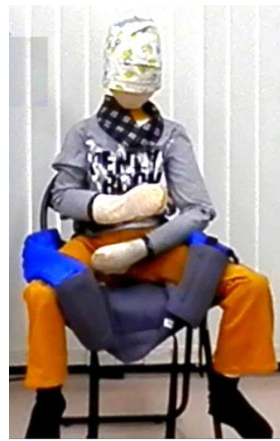
両足を入れた状態