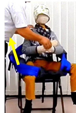
おんぶパーツの手前部分が お子様の股の間から少し 見えるくらいまで、おんぶ パーツを引き上げます