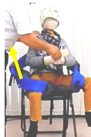
おんぶパーツの手前部分が お子様の股の間から少し 見えるくらいまで、おんぶ パーツを引き上げます