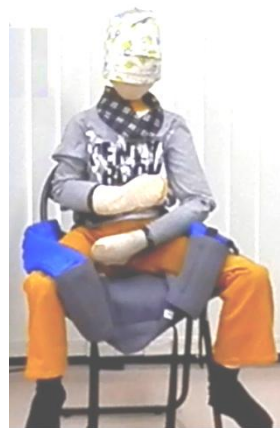
両足を入れた状態